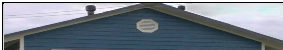
Верхний фриз - планка, соединяющая софит свеса крыши и доски на стене (белая планка вдоль крыши)