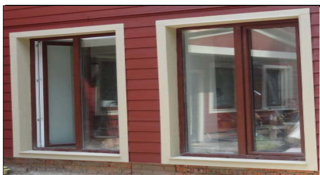
Тримы для окон необходимо обчислять вокруг всего окна - сверху и внизу, слева и справа (формула периметра прямоугольника)