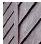
елочка НЕ выступает